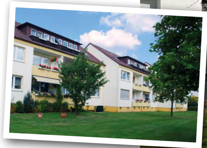
Die Maßnahme am Birnbaumweg ist ein Pilotprojekt der allerland für weitere Quartiersentwicklungen der Bestandsbauten der Gesellschaft im Hinblick auf den Klimapfad 2045. Das kleine Foto zeigt die Anlage vor der Sanierung.

Trotz vieler unvorhersehbarer Schwierigkeiten wie die Corona-Krise und der damit verbundene Mangel an Arbeitskräften sowie Lieferschwierigkeiten für Baumaterial wird das Projekt, welches im Spätsommer 2020 begonnen wurde, nun im Mai 2022 erfolgreich zu Ende geführt.