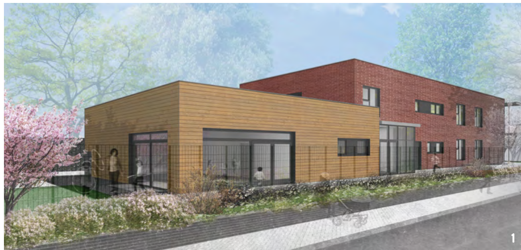
1 Das neue Gebäude in Altenhagen wird bis zum Jahresende fertiggestellt. 2 In Groß Hehlen entsteht ebenfalls ein Kita-Neubau.